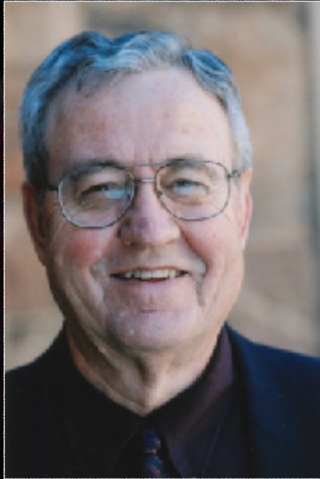
Dallas Willard A conspiração divina

Gradualmente foi se insinuando em minha mente a percepção de que Deus enxerga isso o tempo todo. Ele vê, vivencia, conhece tudo isso de cada possível ponto de vista, essa e bilhões de outras cenas iguais e diferentes, neste e em bilhões de outros mundos. Enormes vagalhões de alegria devem constantemente varrer o seu ser. Acho que é estranho dizer isso, mas de repente fiquei tremendamente feliz por Deus e julguei compreender, mesmo imperfeitamente, a consciência infinitamente jubilosa que ele é e o que deve ter significado para ele olhar para a sua criação e considerá-la “muito boa”.